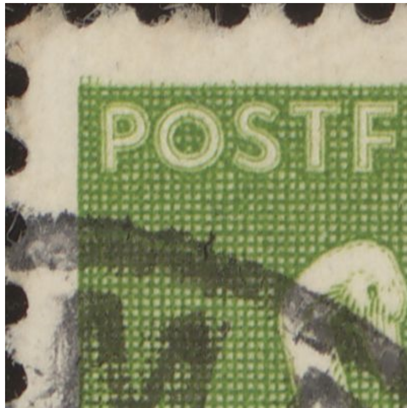
223y nr. 92 i hvert 2. ark