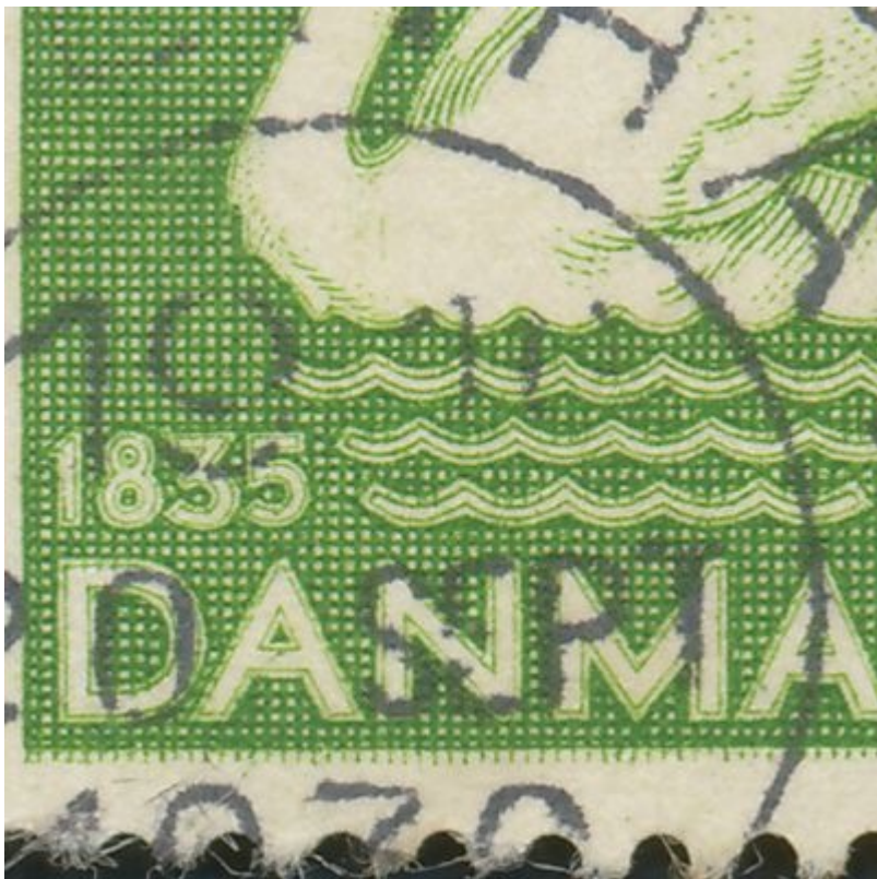
223x nr. 81 i hvert 2. ark